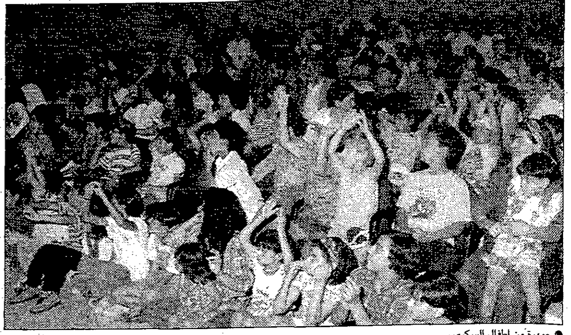
● جمهرة من أطفال السكري